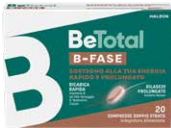
BETOTAL B-FASE 20 compresse doppio strato