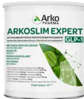
ARKOSLIM EXPERT GLP-1 270 g