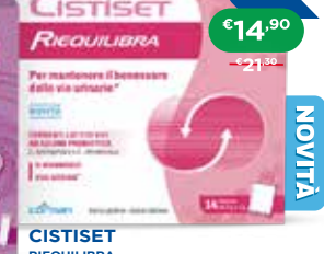
CISTISSET RIEQUILIBRA 14 bustine da 2 g + 2 g