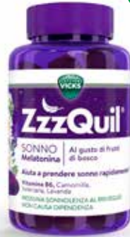
VICKS ZZZQUIL SONNO MELATONINA