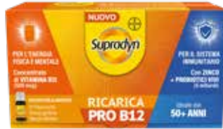
SUPRADYN RICARICA PRO B12 10 flaconcini