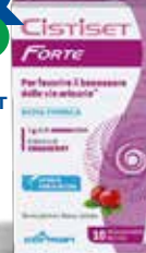
CISTISSET FORTE 10 Stick orolubili da 2,5 g