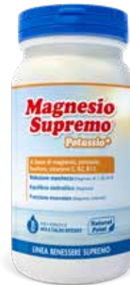
MAGNESIO SUPREMO POTASSIO+ • 150 g • 24 bustine