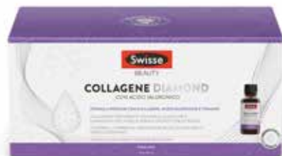
SWISSE COLLAGENE DIAMOND 10 flaconcini da 30 ml

CONTINUA LA PROMOZIONE DI MAGGIO VALIDA FINO AL 30 GIUGNO 2026