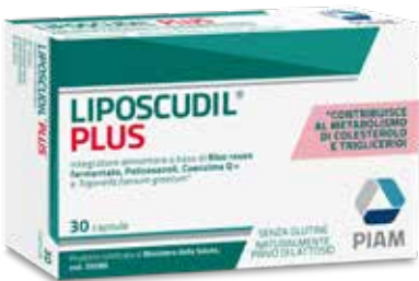
LIPOSCUDIL PLUS 30 capsule