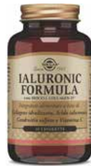
IALURONIC FORMULA 30 tavolette