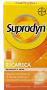
SUPRADYN RICARICA 30 compresse effervescenti