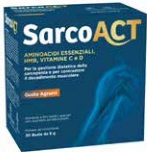
SARCOACT 30 buste da 8 g gusto agrumi