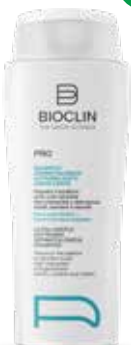
BIOCLIN PRO SHAMPOO DERMATOLOGICO ultradelicato addolcente 400 ml