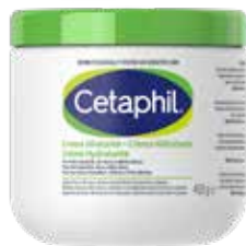
CETAPHIL CREMA IDRATANTE 450 g