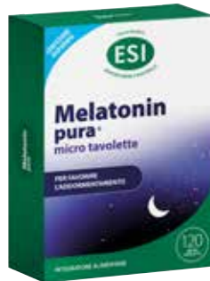
ESI MELATONIN PURA 120 micro tavolette